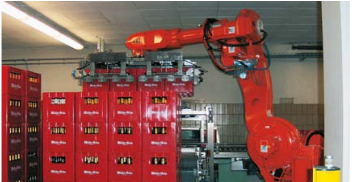
Schnell, sanft und präzise – der Roboter macht's möglich.