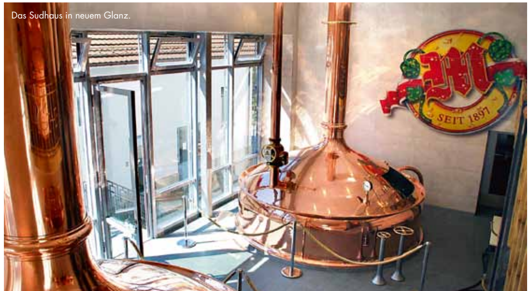
Das Sudhaus in neuem Glanz.

Ein Blick ins neue Sudhaus überzeugt: Die Ausstattung wurde mit einem Investitionsvolumen von rund CHF 2,3 Mio. auf den neusten Stand der technischen und ökologischen Entwicklung gebracht. Im Herzen der Brauerei Müller entsteht hier weiterhin nach traditioneller Braukunst sowie geheimer, hauseigener Rezeptur das typische MüllerBräu, das einfach schmeckt.