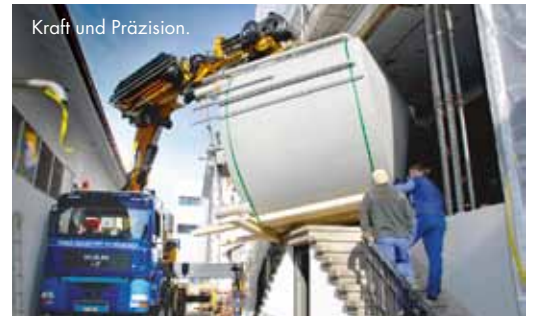
Kraft und Präzision.