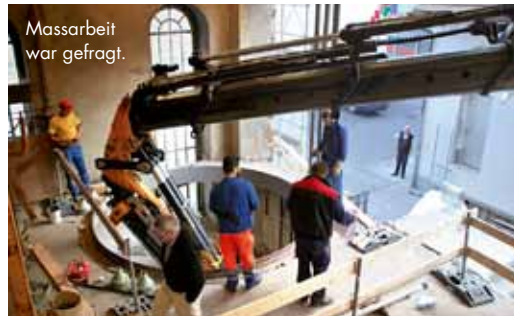
Massarbeit war gefragt.

PS: Mehr Infos auf www.brauerei-mueller.ch